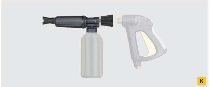
HV M22 drehbar. Lanze mit Dosierung und Flasche. Max. 250 bar / 80 °C