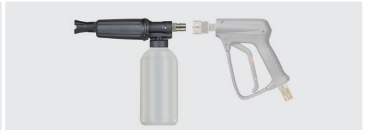
ST-45-250 Edelstahl. Lanze mit Dosierung und Flasche. Max. 250 bar / 80 °C